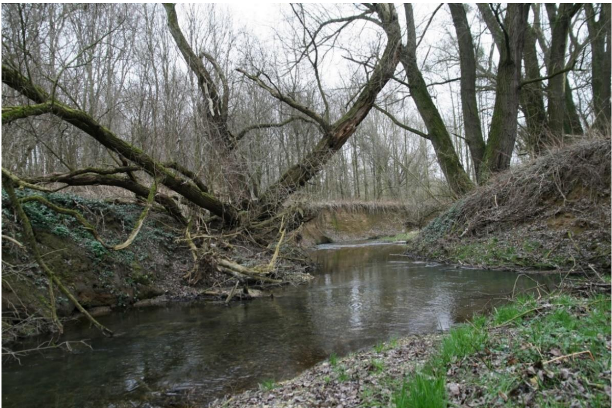
Naturnaher Verlauf der Riehe mit Steil- und Flachufeln und Weiden-Auwald