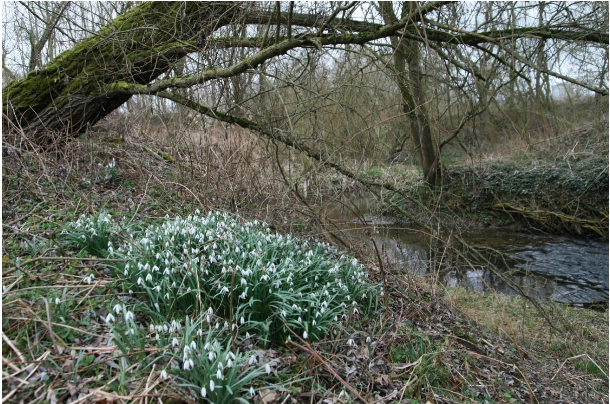
Große Bestände von Schneeglöckchen unter den Weidenbäumen