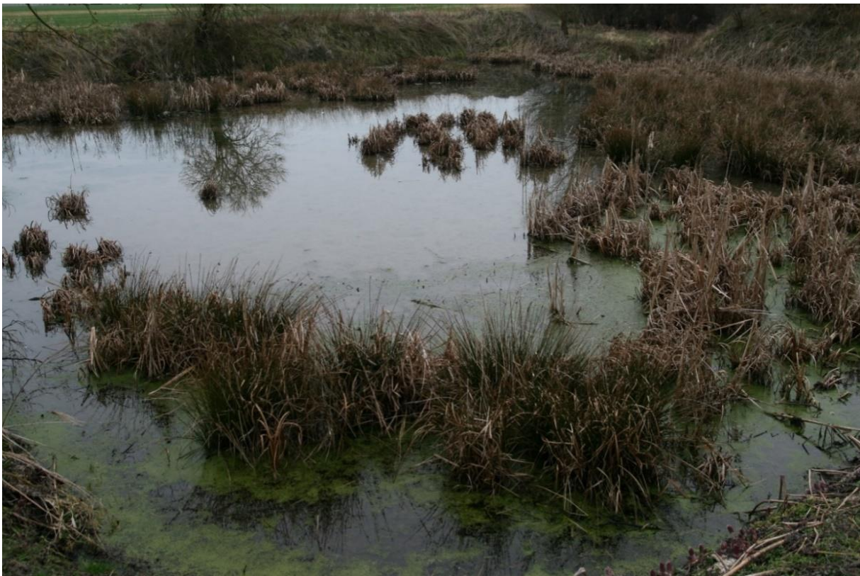
Verlandungsbereich mit Röhricht, Binsen und Wasserlinsen